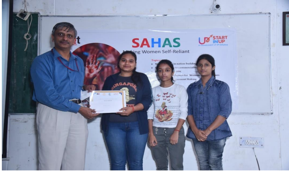
(Team Fighter – Second Prize Rs. 1000/- and Certificates)