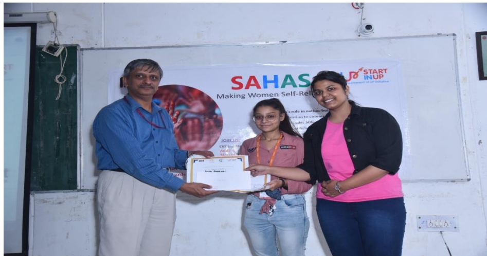
(Team Sashakt- First Prize of Rs. 2000/- and Certificates)